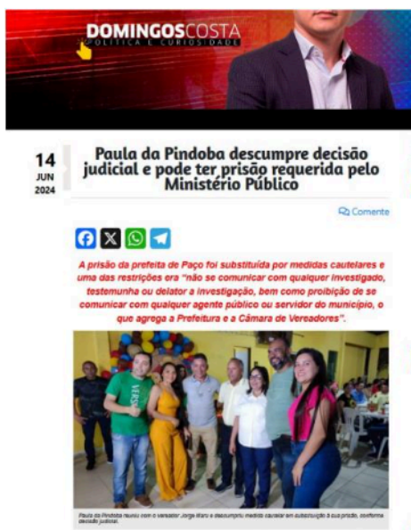
Notícia no Blog Domingos Costa 3